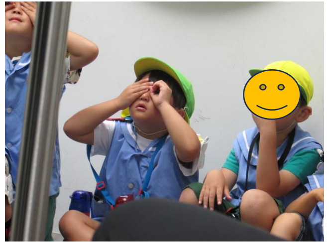
展示室にも興味津々の子ども達！楽しそうな笑顔で見学していました。