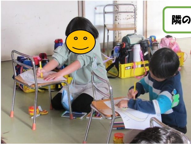
隣のお店は黄色の目立つどんぶりか…