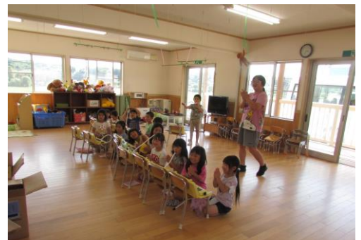
練習の成果が！子ども達と合奏することが出来ました。