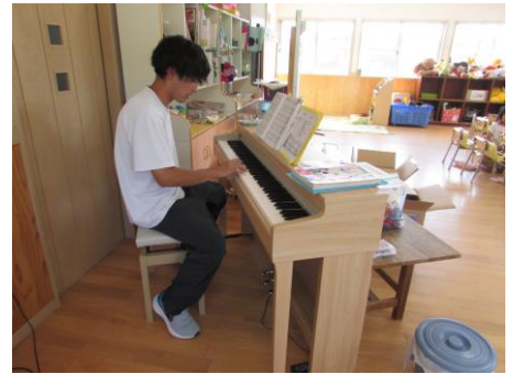
樹先生、今度はピアノに挑戦です。