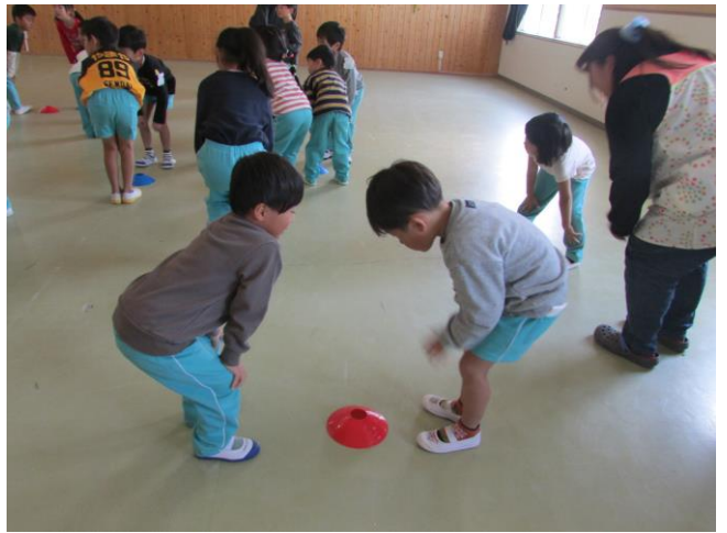
笛が鳴ったらタグを取り先に頭に寄せたほうが勝ち！と言われ真剣に挑む子ども達！