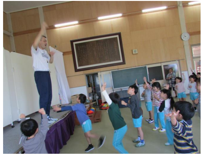
座ったりジャンプしたり、右手は上、左手は胸など笛の合図で動きました。