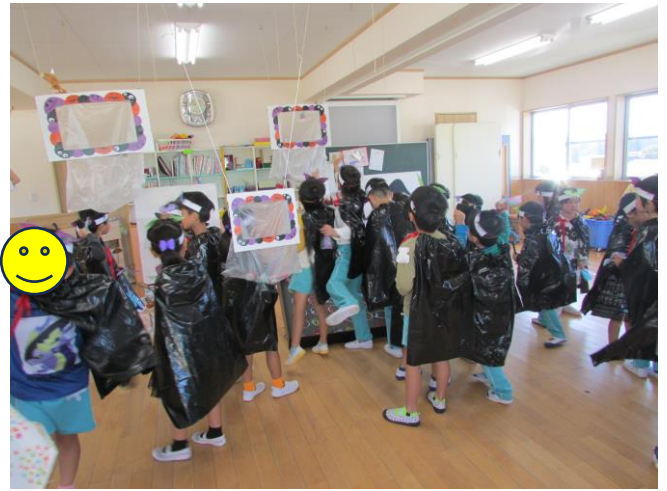
マントにワッペンをつけてもらいました