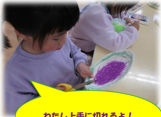
わたし上手に切れるよ!