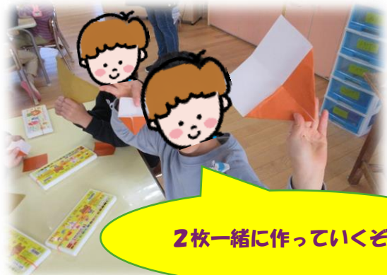
2枚一緒に作っていくぞ!!