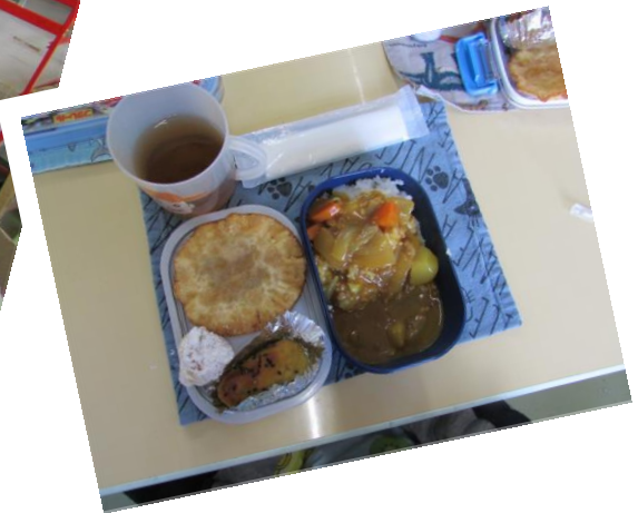
1学期はカレーライス が苦手だったけど 美味しかった！