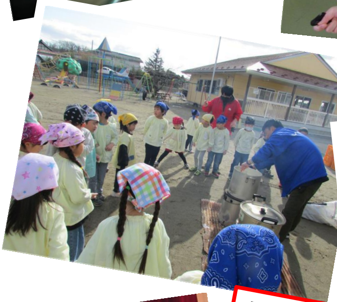
ピカピカのお米が炊き上がりました みんなが作った新米です！