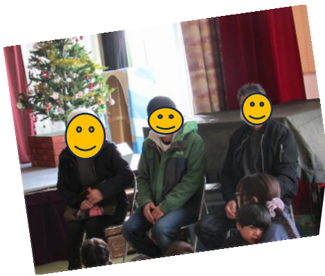
お客様が3名いらっしゃいました。 クラスで作ったプレゼントを渡し、歌を聞いていただきました。