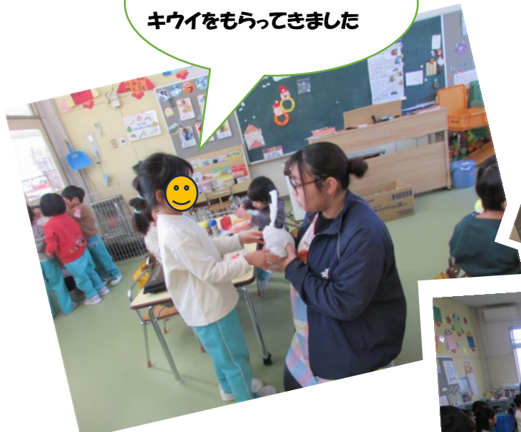
かつおさんのおにわから キウイをもらってきました