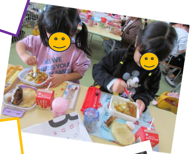
カレーは混ぜる派？ 混ぜない派？ そんな会話が聞こえてきました