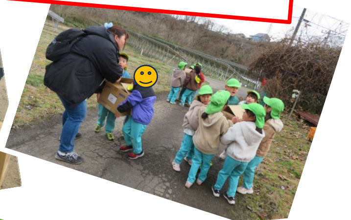
おいしょ！おいしょ！ さいしょはぼんださんにとどけよう