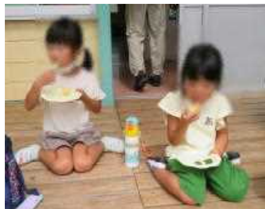
何も付けなくても 美味しい〜！！