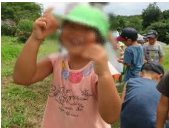
このまま 食べたいな～。