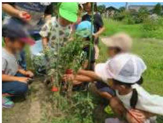
ここにも、なってる～！