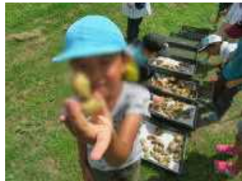
おもしろい形 発見!!