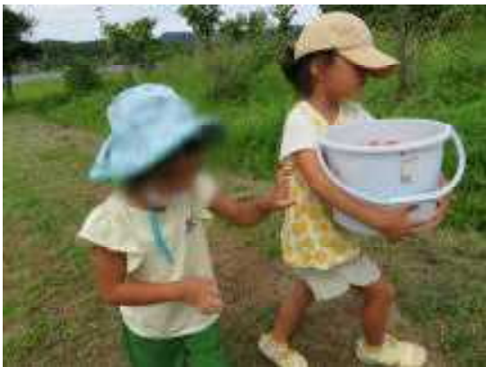
取れた野菜は自分たちで運びます。