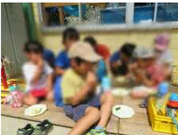
お外でおやつタイム。