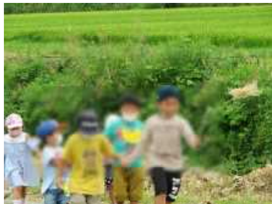
ススキの旗で 出発！！