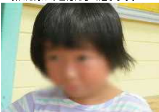
美味しくてじゃがいもの おひげ。