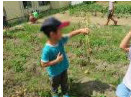
いっこだけだった〜(笑)