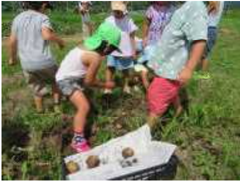
土を掘ると中からまだまだ～