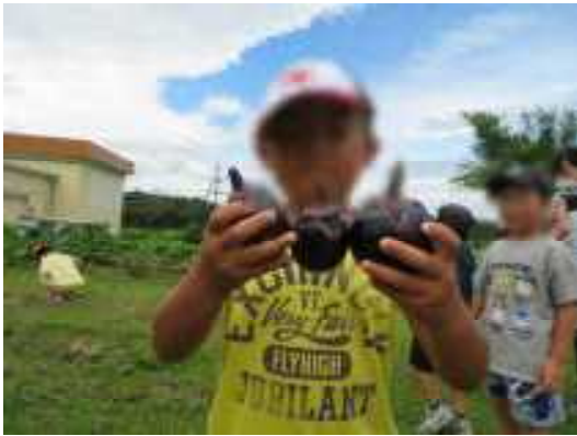
まん丸ナス～親子かな？