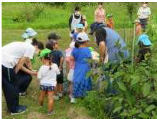
せんせい、これなんのはっぱ？