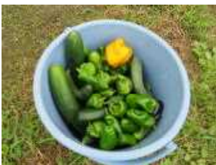
この日の収穫～ バケツにいっぱい！ 黄色のピーマン、食べてみたい！！