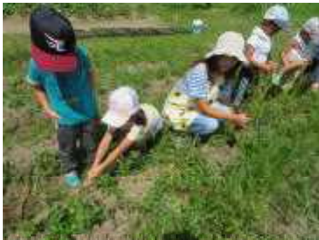
うんとこしょ! どっこいしょ!!