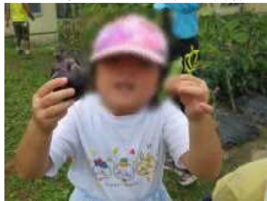
お店より美味しそう、でしょ♥