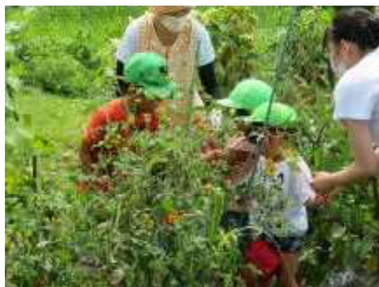
トマトの葉っぱ、チクチクするね