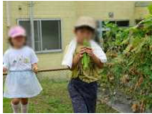
おっきなオクラ ざらざらしてる。