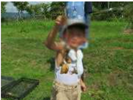
じゃがいもファミリー♥