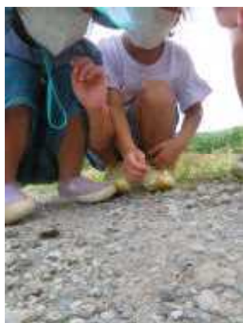
虫発見！虫もこんなに 見つめられたら緊張しちゃう。 ◀ さあ 2学期がスタート！