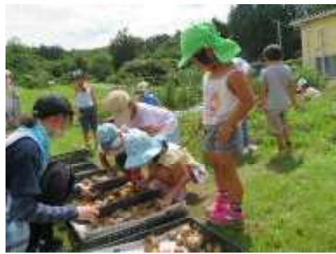
取れたお芋は種類や大きさで分けました。