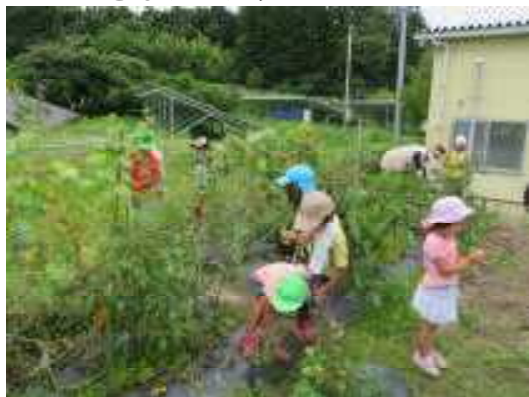
きいろいトマトだ～！！