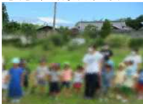
みんな集まって～いっぱいだよ！！