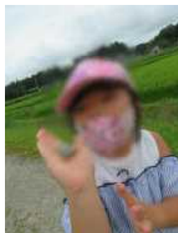
何でもない石も おもちゃに変身！ 預かりファミリーは今日もな・か・よ・し！！ ▶