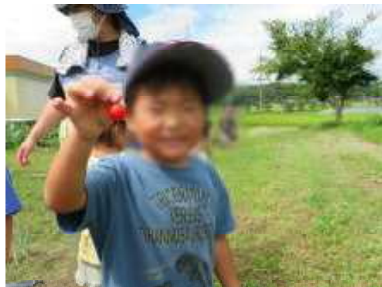
自分で取ったからね、いい笑顔