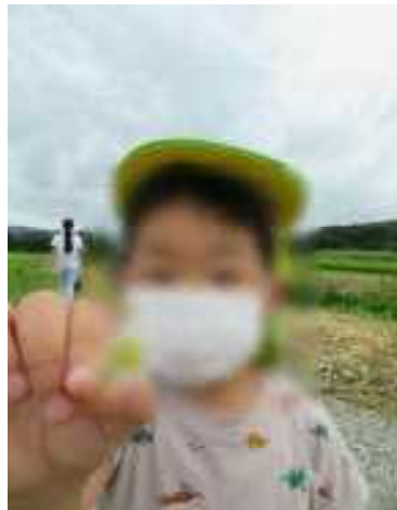
初めて見た花～ ママにお土産かな？