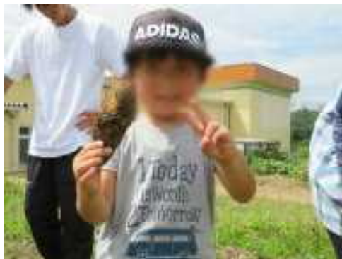
おっきなじゃがいも み～っけ!!