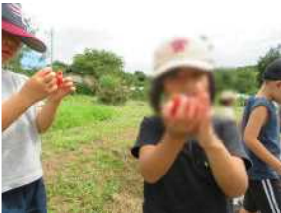
トマト・・・大切に持ってるね。