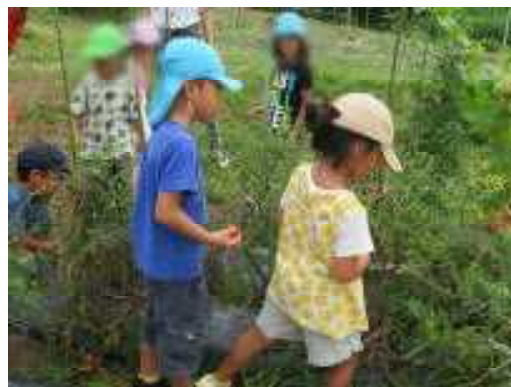
そっちには、なにかなってる？