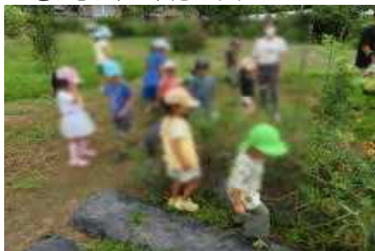
もっと、取りたいな～