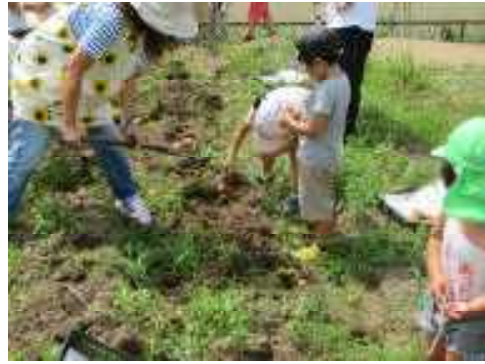
スコップで掘るとまだまだまだまだ沢山