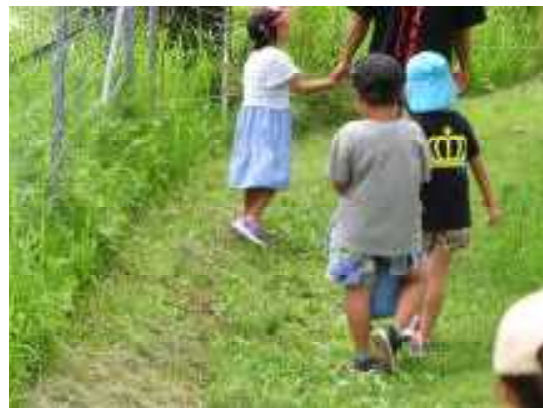
ね〜ね〜、いつ食べるの？