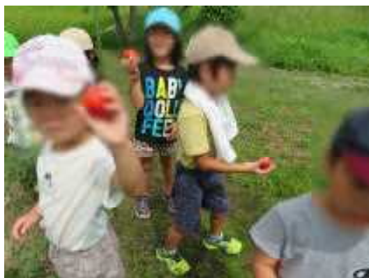
おおきなトマトみっけ～！！