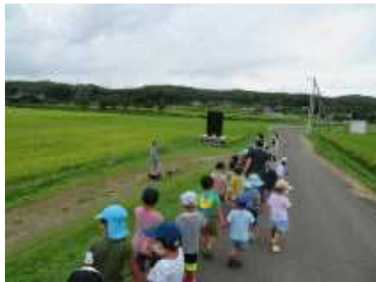
お散歩のワンちゃんにご挨拶。

涼しい時にはみんなでお散歩。大沢幼稚園の周りには自然がいっぱい！ 今日はどんな発見があるかな？ さあ 冒険だ～♪