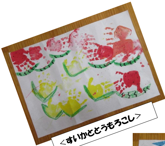
<すいかとうもろこし>