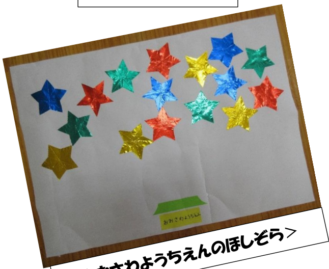
<おおさわようちえんのほしぞら>