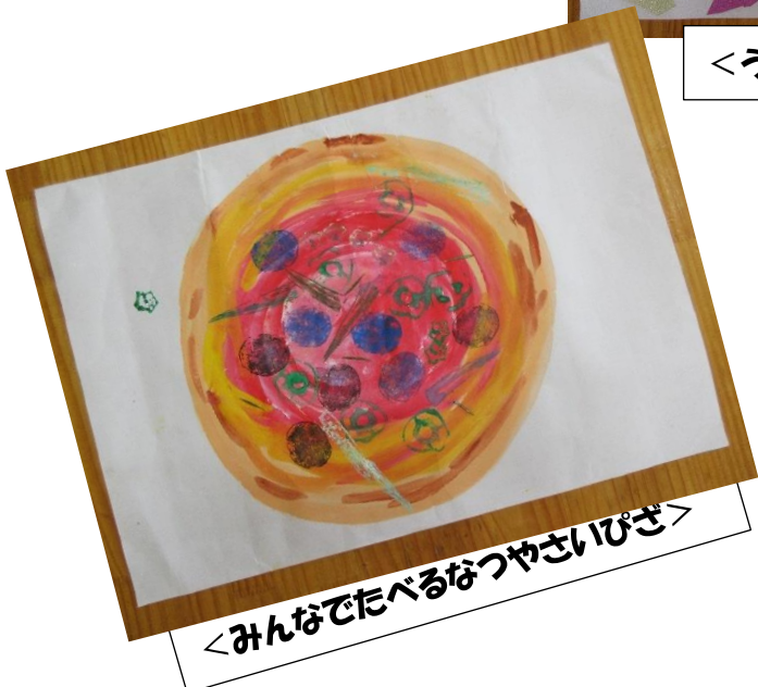
<みんなでたべるなつやさいピザ>