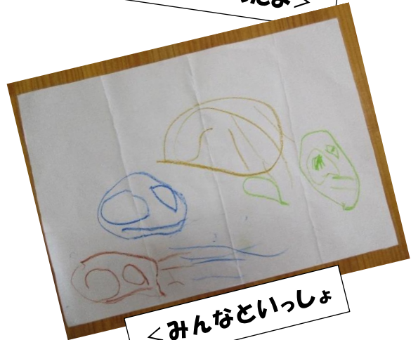
<みんなといっしょ>