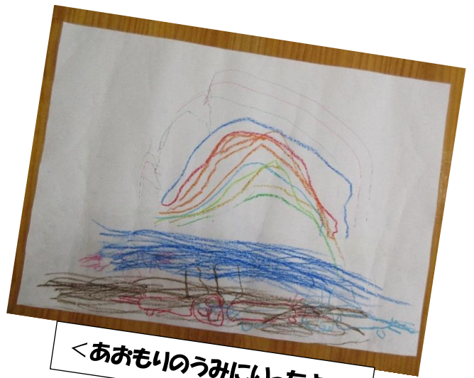
<あおもいのうみにいったよ>