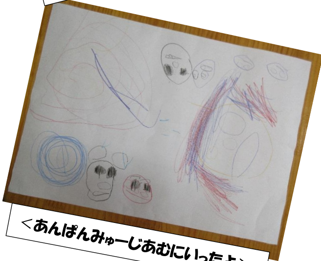
<あんぱんみゅーじあむにいったよ>