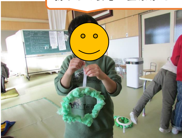
我ながら会心の出来栄え！