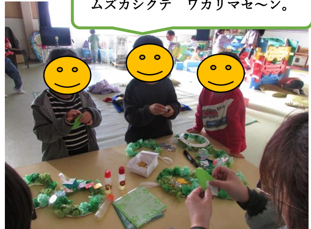
ムズカシクテ ワカリマセ〜ン。